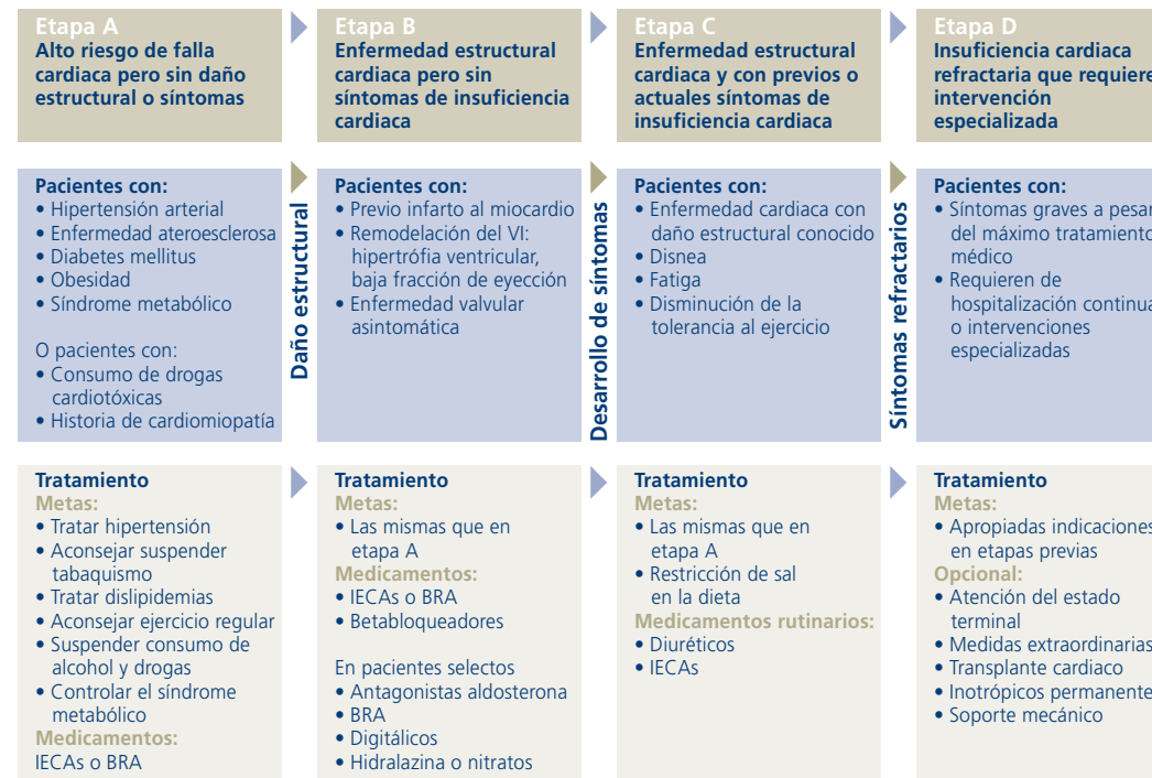
FIGURA 1. ETAPAS DE LA INSUFICIENCIA CARDIACA CRÓNICA

Hunt SA. ACC/AHA 2005 Guideline up for the diagnosis and management of chronic heart failure in the adult. 8