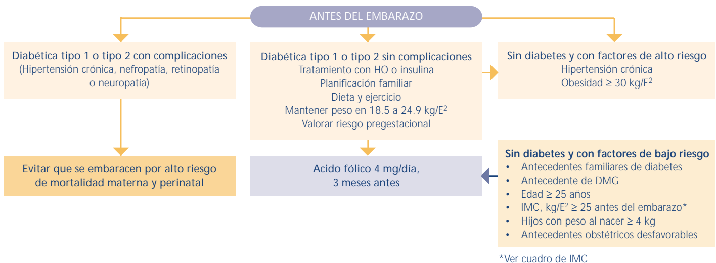
FIGURA 1. ACCIONES DE ATENCIÓN A LA MUJER CON DM ANTES DEL EMBARAZO

EL DIAGNÓSTICO DEFINITIVO REQUIERE DE LA PRESENCIA DE DOS VALORES IGUALES O MAYORES A LOS SIGUIENTES EN PLASMA 3, 4, 9